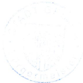
Osmar Brück Bürgermeister